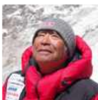
三浦 雄一郎 氏 プロスキーヤー / 冒険家 / クラーク記念国際高等学校 校長