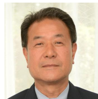
星野 敏男氏 明治大学 名誉教授