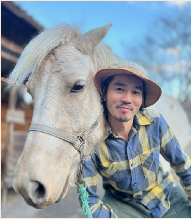
豊 原 黍